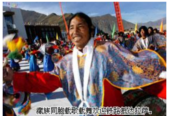
藏族同胞載歌載舞歡迎鐵路抵達拉薩。